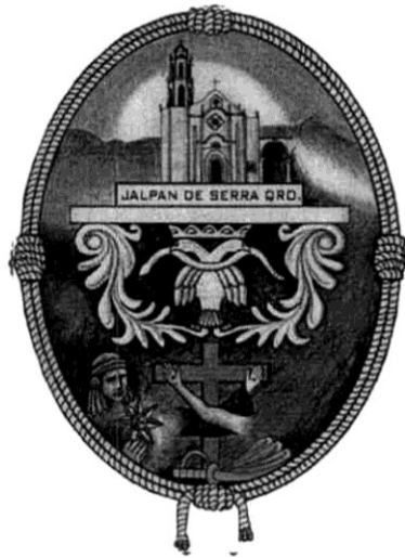
MUNICIPIO DE JALPAN 2018-2021