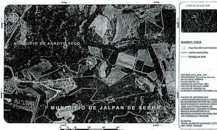
Plano del Límite municipal de Jalpan de Serra, Qro.

Límites intermunicipales del Estado de Querétaro dentro del marco Geoestadístico nacional del 2022 del INEGI y medios magnéticos de cartografía parcelaria del RAN.